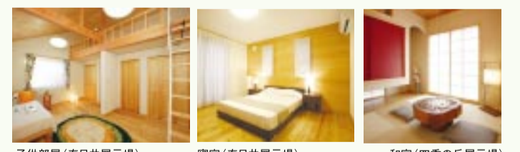
子供部屋(春日井展示場) 寝室(春日井展示場) 和室(四季の丘展示場) カバヅクラ ナラ 桐 アカ松 カラ松

シックハウス症候群の原因は、住まいの気密性が高くなったことでたまってしまった有毒な物質(ホルムアルデヒド)が引き起こすものです。木に含まれる成分は人にとって無害なものばかり。そのうえ木には有毒な物質を吸収する能力もあります。また、木の香りには人の心と身体をリラックスさせるフィトンチッドという成分(ストレス解消、殺菌効果)が含まれています。